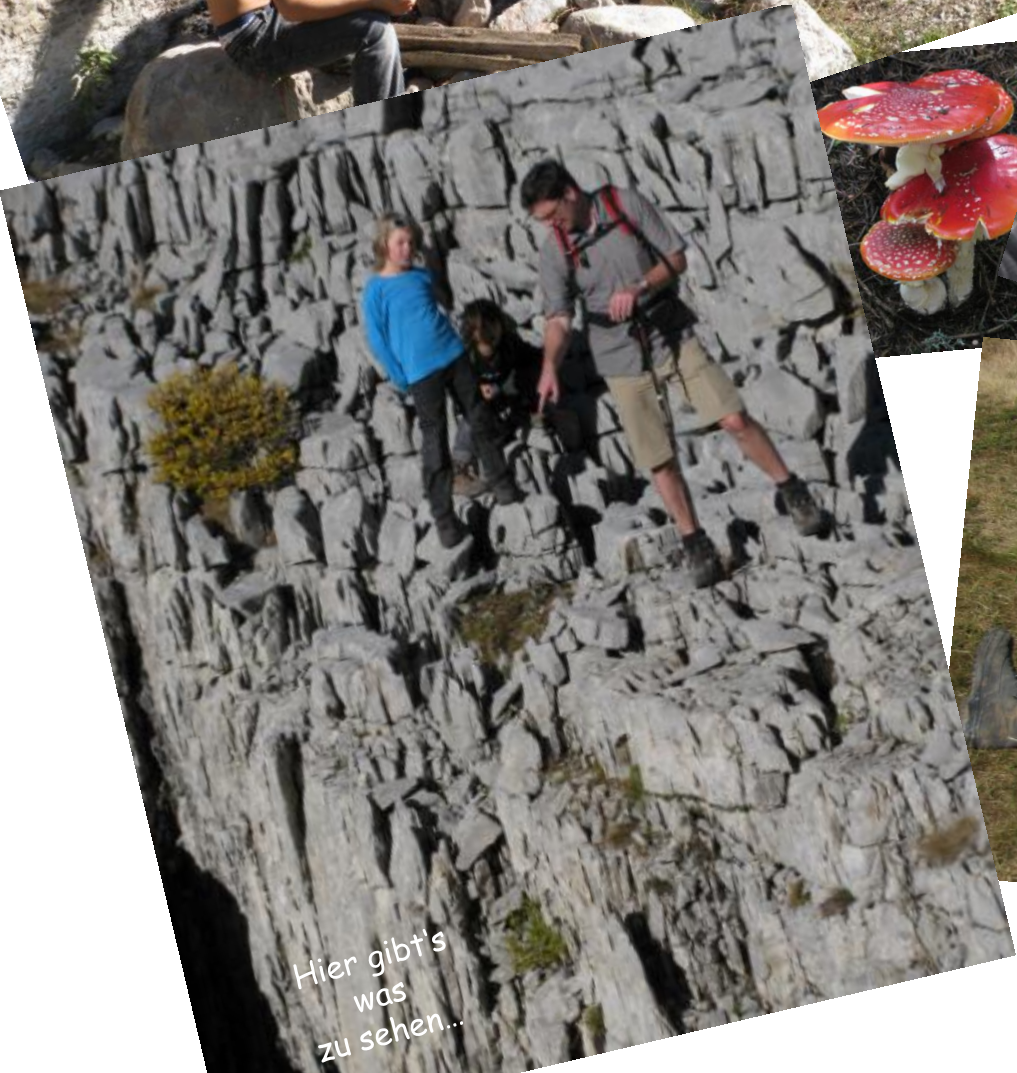
Hier gib't's was zu sehen...