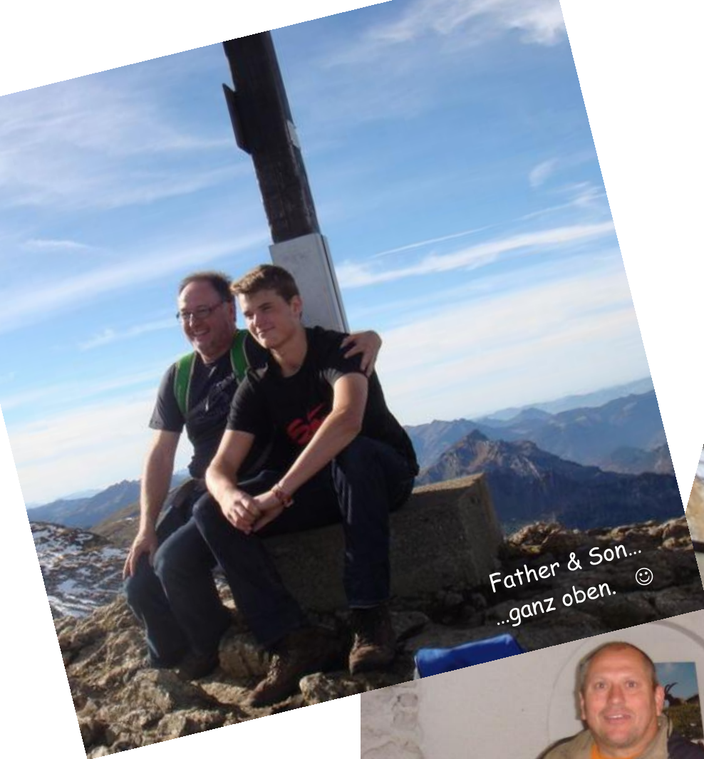
Father & Son... ...ganz oben. ☺