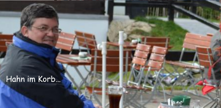
Hahn im Korb...