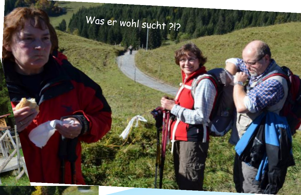
Was er wohl sucht?!?