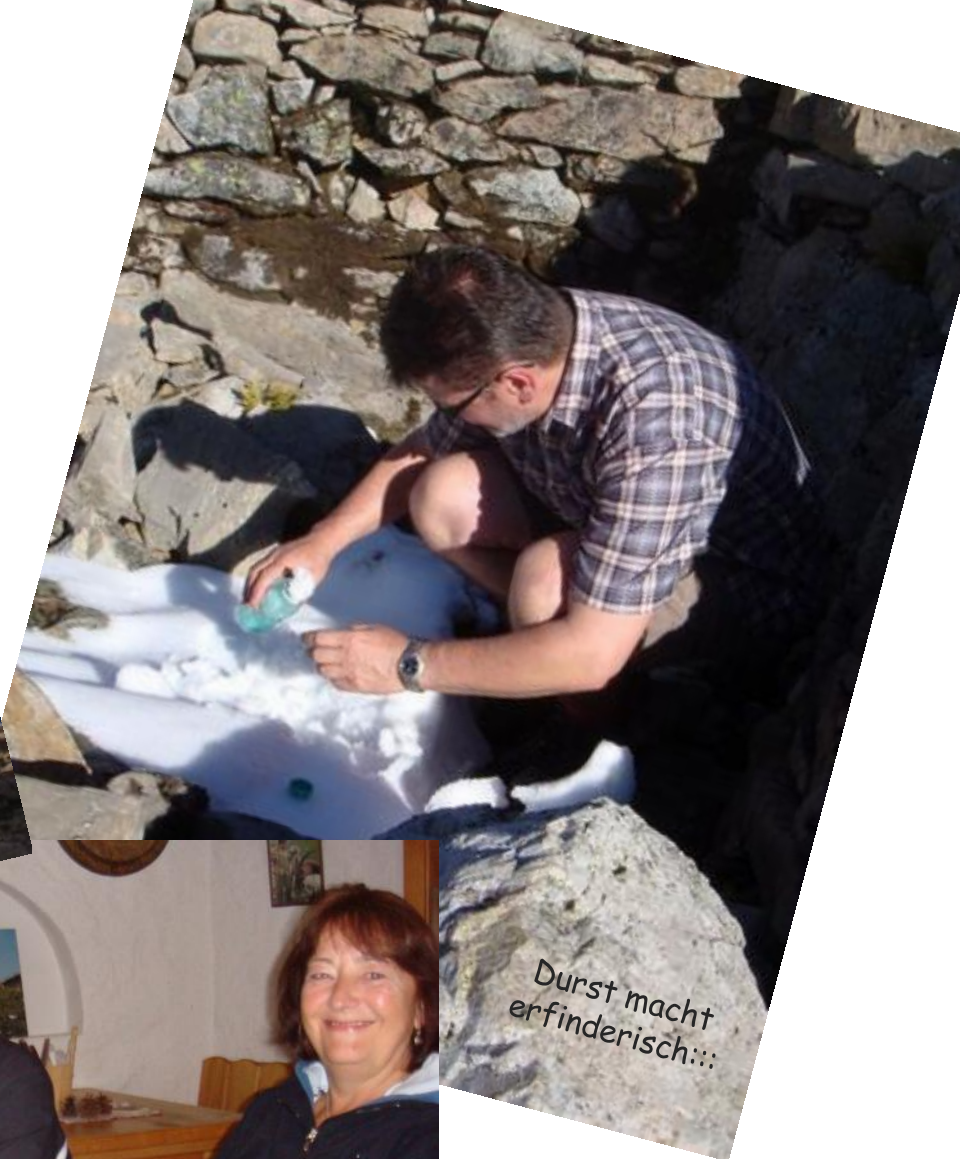
Durst macht erfinderisch:::