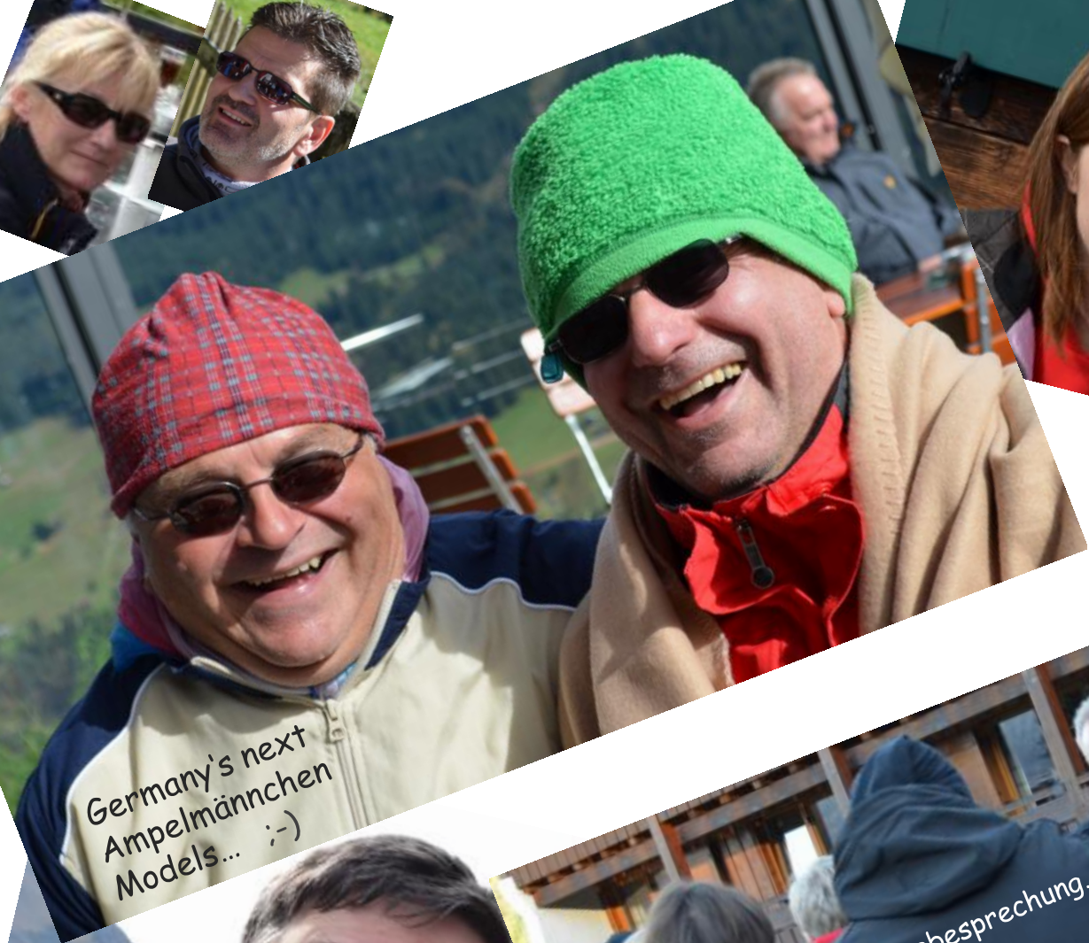
Germany's next Ampelmännchen Models... :-)