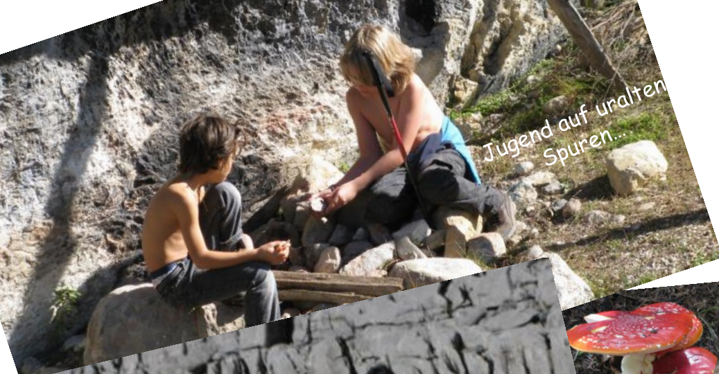
Jugend auf uralten Spuren...