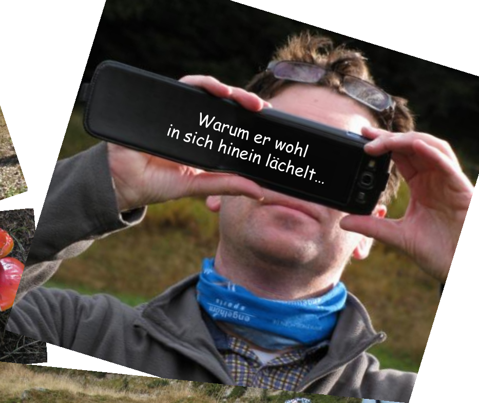
Warum er wohl in sich hinein lächelt...