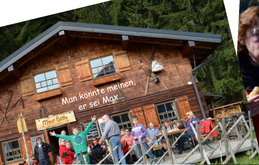
Man könnte meinen, er sei Max...