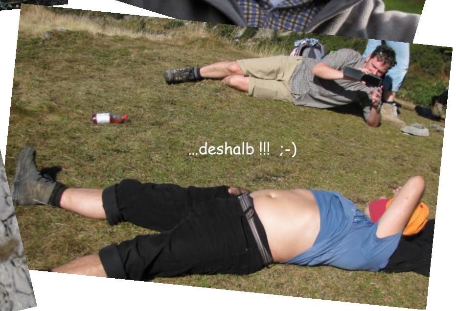
...deshalb !!! ;-)