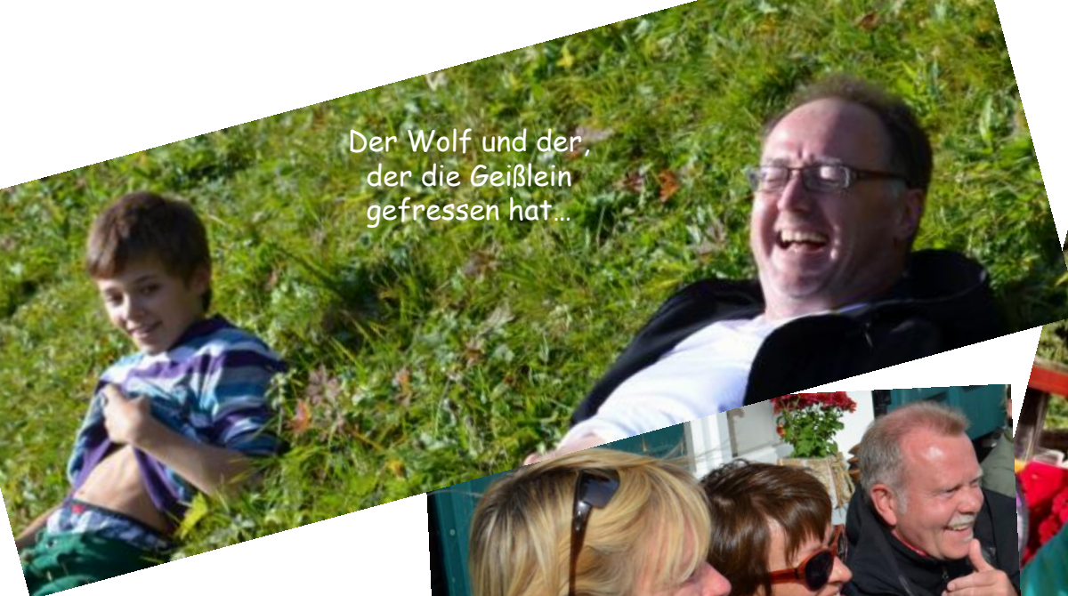
Der Wolf und der, der die Geißlein gefressen hat...