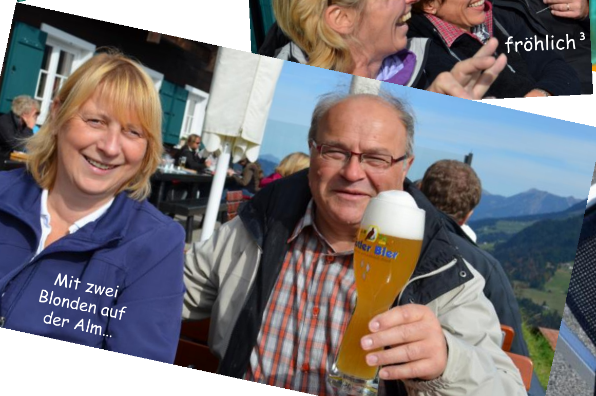
Mit zwei Blonden auf der Alm...