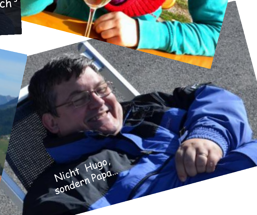
Nicht Hugo, sondern Papa...