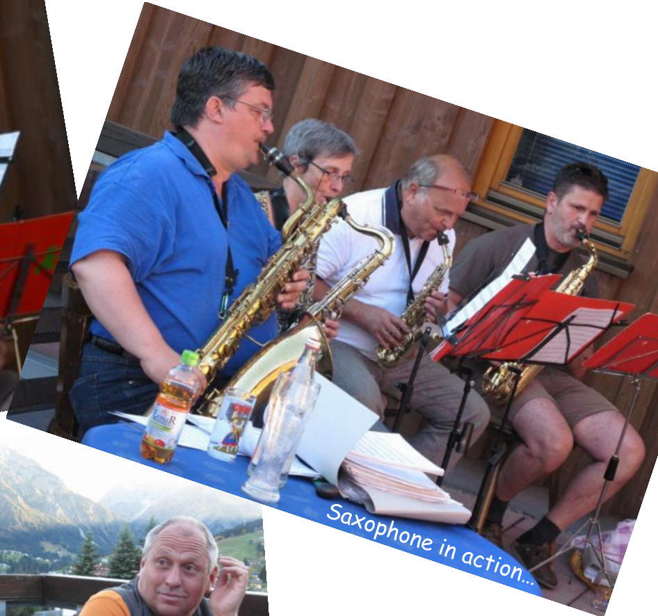
Saxophone in action...