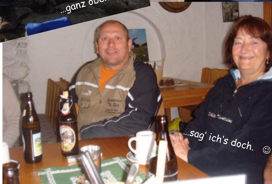
...sag' ich's doch. ☺