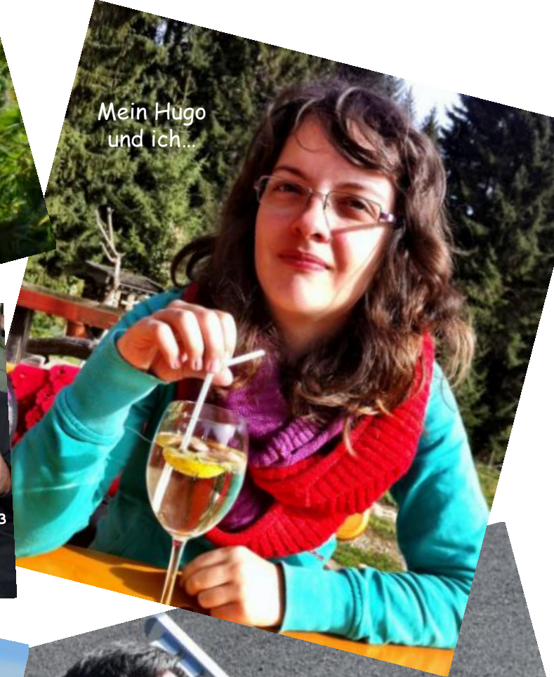
Mein Hugo und ich...